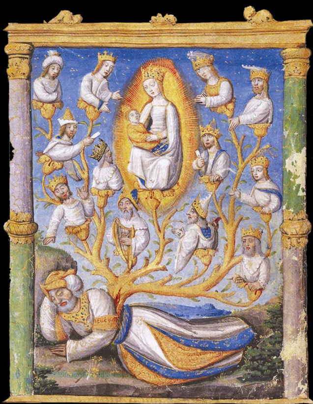
La souche de Jessé